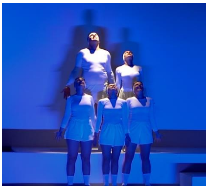
'Paradisos' van Leo en Lions

Het jaarlijkse Landjuweelfestival van OPENDOEK toont theater in de vrije tijd in al zijn kwaliteit en diversiteit. Het festival presenteert een scala van de meest belangwekkende voorstellingen die het voorbije theaterseizoen te zien waren in Vlaanderen en Brussel. In november pronken ook theatergezelschappen Theaterspektakel (Herentals) en Leo en Lions (Mol-Geel) op het programma van het Landjuweelfestival.