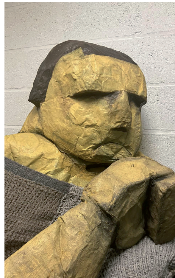
De Golem © Margerita Sanders

"Ik denk dat het vooral gaat over het creëren van een afstand. Het gebruik van maskers werkt drempelverlagend. Iets zwaars wordt behapbaar en krijgt dankzij een masker een andere dimensie, waardoor het bij iedereen anders overkomt. Je kan een emotie overbrengen die toch nog ruimte biedt voor eigen interpretatie. Het laat mensen zelf nadenken en reflecteren over wat er precies wordt bedoeld en daarbij bestaat er niet per se een goed of fout antwoord."