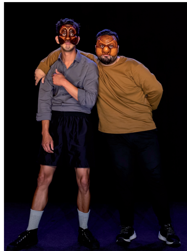
Kamerich & Budwilowitz © Troupe Courage

"Meestal houden de acteurs of gezelschappen de maskers bij. Vooral als het gaat over op maat gemaakte maskers. Dat is dan specifiek voor één bepaalde persoon en rol en kan dan ook enkel voor dat bepaald stuk dienen. Vandaar dat ik vaker een iets breder masker maak dat niet helemaal op maat is, maar dat meer vrijheid biedt aan wie het draagt. Dergelijke maskers kunnen we eenvoudiger inzetten voor andere voorstellingen of educatieve sessies. Dat is dus ook duurzamer."