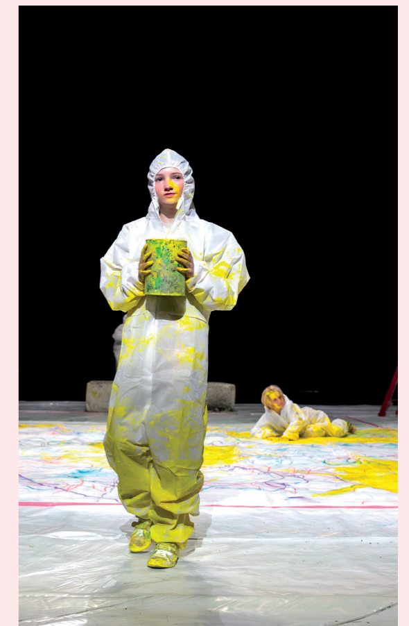
WASCO - scènebeelden

“Jeugdtonel gaat vaak over wat volwassenen denken over kinderen, niet over kinderen zelf. Dat vind ik flauw.”