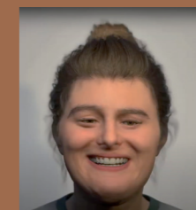
Gezelschap Kaboekie maakte acteurs tot avatars.

Ook jeugdtheater Kaboekie uit Zonhoven deed dat voor hun voorstelling 'Inteam'. Enkele acteurs werden omgetoverd tot avatars met behulp van verschillende softwareprogramma's (Dreamface, Agisoft Photoscan, Unreal Engine, Metahuman Creator...). Ze zijn er zelfs in geslaagd om de avatars te animeren, wat een heel leuk resultaat opleverde.