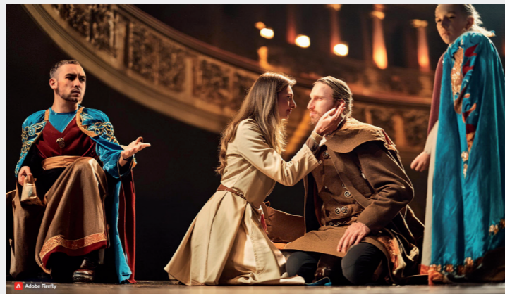
Romeo en Julia © Adobe Firefly

Er gaat geen dag voorbij of we worden overspoeld met berichten over hoe artificiële intelligentie ons leven zal veranderen. Maar laat de onwetendheid of misschien wel de angst je niet remmen om ermee aan de slag te gaan. Redacteur Frank Wertelaers, onze nerdy enthousiasteling, somt zeven toepassingen op voor de theaterwereld die veilig, redelijk makkelijk in gebruik, en gratis of goedkoop zijn.