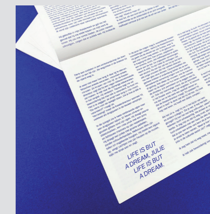
'Life is but a dream' - Julie Cafmeyer

Fictie gebruiken om echte problemen van echte mensen aan te kaarten. Cafmeyer schrijft zich daarmee in de lange traditie van grote namen als Molière en Brecht. En ze leefden nog lang en gelukkig? Dat is pure fictie!