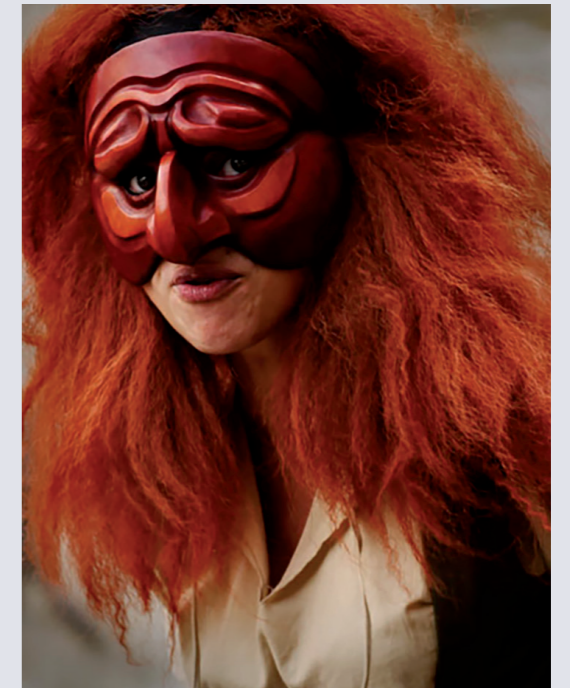
Masque de Polichinelle

"Hoe vaker ik het doe, hoe meer het voelt als een vorm van meditatie. Tijdens het creatieproces ben ik zeer aandachtig en geconcentreerd op wat ik doe en vervalt mijn tijdsbesef volledig. We leven in een zodanig hectische wereld, waardoor we vastzitten tussen heden, verleden en toekomst. We zijn vergeten hoe we in het moment moeten leven en zijn daardoor eerder toeschouwer geworden dan deelnemer. Er is een gigantisch gebrek aan connectie, zowel met onszelf als met de ander. Werken aan maskers of aan gelijk welke kunstvorm tout court , voelt voor mij aan als het herontdekken van een eenheid."