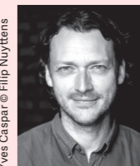
Yves Caspar

Eerst hebben we het programma een aantal dialogen van Caspar laten samenvatten en analyseren, via scènes uit zijn stukken '30', 'De schoonste dag' en 'Lijst Lenaerts'. Daarna vroegen we CoPilot om zelf een plot, een aantal personages en twee scènes uit te werken. Het resultaat las je dus op de vorige bladzijde. Maar wat vindt Yves Caspar hier zélf van?