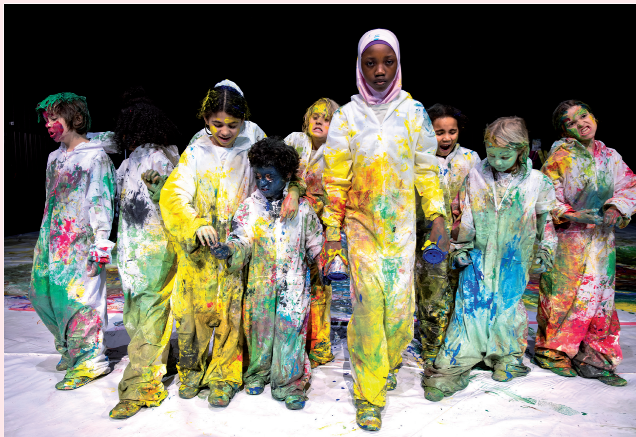
WASCO - scènebeelden

Weet je wat nog leuker is dan kleuren? Buiten de lijntjes kleuren. Maar om een of andere reden zijn we het er collectief over eens geworden dat een fatsoenlijk mens dat beter niet doet. Dat we de veiligheid van die lijnen maar moeten omarmen. Ik vind dat zonde. En blijkbaar ben ik niet de enige, want de makers en spelers van WASCO! delen mijn verlangen naar wat buiten die lijntjes ligt.