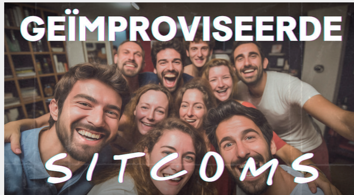
Op deze door AI gegenereerde affiche zien de mensen er nog onecht uit.