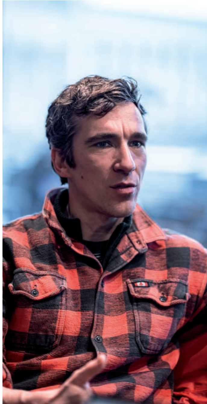
Simon D'Huyvetter

Alice: “Daarom probeer ik spelers bijna altijd als groep aan te spreken. Vanaf het begin dram ik erin dat iedereen gelijk is en iets bijdraagt. En in scènes met veel ensemblewerk ben ik soms zelfs meer bezig met de mensen die op de achtergrond iets kleins aan het doen zijn, om hen het gevoel te geven dat ook zij gezien worden, zich aangesproken voelen en weten dat hun onderdeel soms meer aandacht trekt dan iemand die een monoloog heeft. Want tekst is niet het enige wat ertoe doet.”