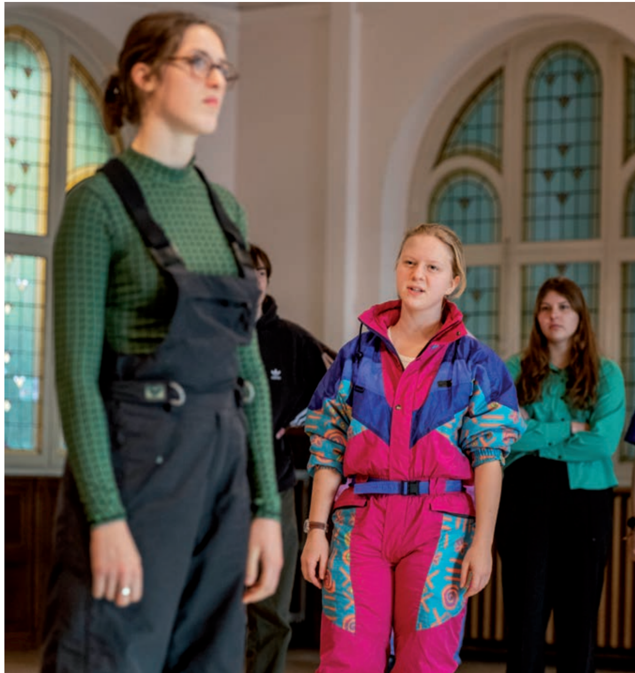
Repetitie van 'Armzalig'