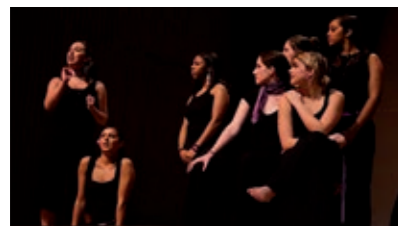
Vaginamonologen in Tufts University

Het eerste waar vrijwel iedereen aan denkt in deze context, is het stuk 'De Vaginamonologen'. Auteur en feministisch activiste Eve Ensler schreef het in 1996, op basis van meer dan tweehonderd interviews met vrouwen van verschillende leeftijden en achtergronden over hun vagina. 'The Vagina Monologues' werd oorspronkelijk maar enkele keren opgevoerd, maar kreeg toch steeds meer bekendheid door (ik verzin het niet) mond-tot-mond reclame. Zo kwam het dat grote namen aan de voorstellingen gingen meewerken, waaronder Whoopi Goldberg, Oprah Winfrey, Meryl Streep en Jane Fonda.