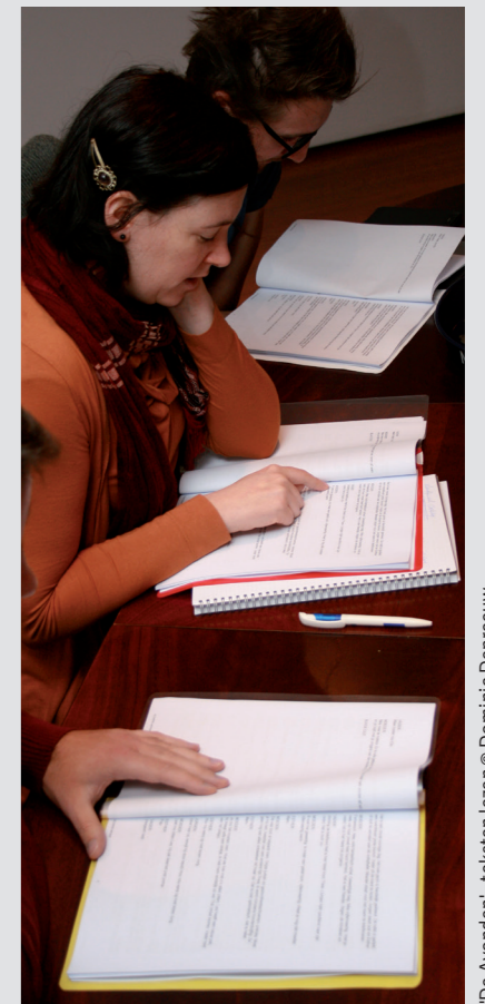
'De Avonden' - teksten lezen © Dominic Depreuw

Als je je tekst wil onderbrengen bij een rechtenbeheerder, zijn er in Vlaanderen vijf opties. Je kan je aansluiten bij Toneelfonds Janssens of ALMO, twee rechtenbeheerders die ook uitgevers zijn, en jou de zorg voor je tekst volledig uit handen nemen. Toneelfonds Janssens en ALMO geven je tekst uit, en verplichten gezelschappen die je stuk willen spelen een aantal exemplaren aan te kopen. Deze boekjes zijn vanaf dan de enige geldige exemplaren van je tekst; je mag je tekst dan niet meer zelf verspreiden. Betalingen en contracten worden via hen geregeld.