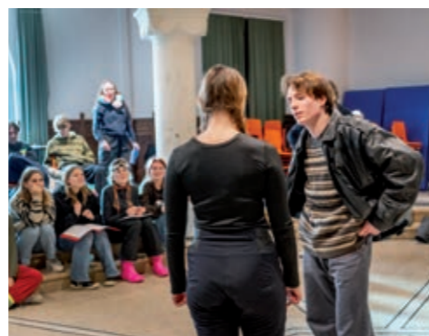
Repetitie van 'Armzalig'

Wie geprikkeld is om te gaan kijken en zich te laten overdonderen door jong talent, kan op 23, 24 of 25 mei de voorstelling bijwonen. Wie weet kan je over tien jaar zeggen dat je die ene beroemde acteur of actrice nog hebt zien spelen in een kleine schoolvoorstelling in Lier.