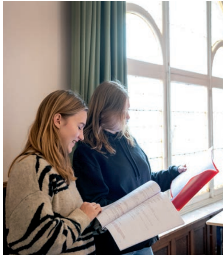
Repetitie van 'Armzalig'

“Het is niet omdat je een kleine rol hebt, dat je niet veel kan leren.”