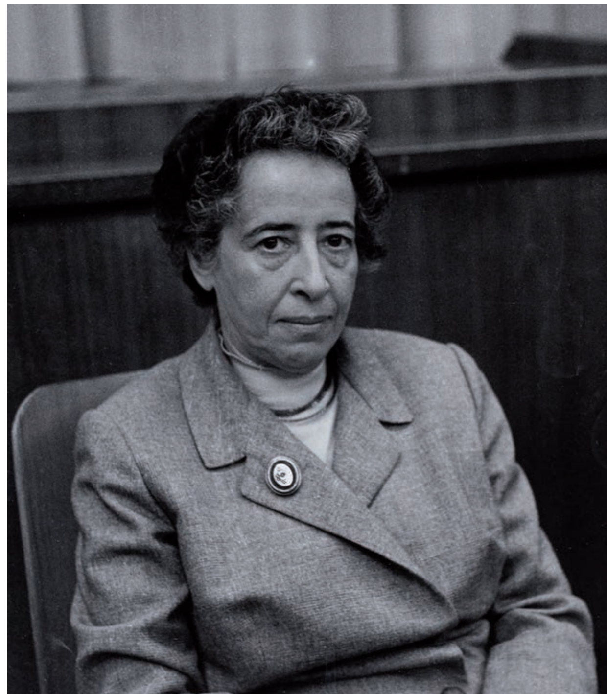
Hannah Arendt

Er is meer. Om het onbescheiden uit te drukken: de mens maakt theater en met dat theater maakt de mens de wereld. Arendt wijdde veel aandacht aan het belang van het spreken. Daarmee bedoelde ze zowel de innerlijke dialoog, die ieder mens in