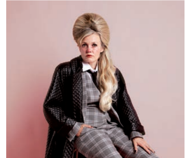
'Ik stond in een kutvoorstelling maar mijn haar zat wel heel goed' Mevrouw Ogterop Producties

Zowel het vrouwelijk als het mannelijk geslacht ontkomen er niet aan: de namen worden vaak gebruikt om negatieve zaken aan te duiden: "Wat een eikel!" of "Het is echt kutweer!" Toneelschrijfster Magne van den Berg heeft daar toch een leuke draai aan gegeven. Van haar is het stuk: 'Ik stond in een kutvoorstelling, maar mijn haar zat wel heel goed'. Ook deze voorstelling draait helemaal rond vrouwen. Actrices zelfs. De personages zijn alle drie in de veertig en hebben al in vele theaters en schouwburgen gespeeld. Nu zitten ze in een kleedkamer, die eigenlijk ook een wachtkamer is. Ze hebben tekst, zijn geregisseed, geschminkt en gekapt, dragen een kostuum en willen zich nu laten horen. Maar wat hebben ze zelf te zeggen nu ze zitten te wachten? Het stuk is een tragikomische ode aan actrices. Je zou ook kunnen zeggen: het is een foefje om in het theater het theater op de hak te nemen.